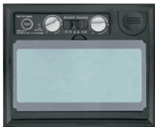
Perillas para ajuste de sensibilidad y retardo en panel digital