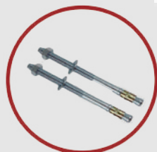
Pernos de anclaje de 1/2 x 7"