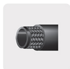
Manguera reforzada trenzada, 3 capas