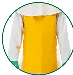
Delantal en PVC para protección impermeable