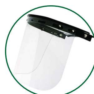
Visera para protección del rostro