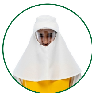
Gorra en tejido repelente al agua