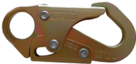
GANCHO PEQUEÑO DE 3/4" DE APERTURA DE PUERTA RESISTENCIA DE COMPUERTA DE 3600 lbs