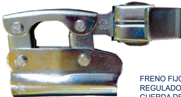
FRENO FIJO REGULADOR PARA CUERDA DE 5/8"