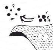
Resistente a partículas