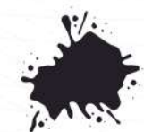
Resistente a salpicaduras