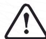
NO USAR EN EXPOSICIÓN A ALTAS TEMPERATURAS