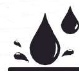
Resistente a líquidos