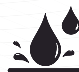
Resistente a líquidos

Material SMS para Mayor Comodidad: El “Traje Desechable Orange Air Protection” ha sido diseñado pensando en tu comodidad en entornos laborales exigentes. Está confeccionada con material SMS, que ofrece una mayor transpiración y un ambiente corporal aireado. Esto se traduce en un confort excepcional durante largas jornadas de trabajo, permitiéndote mantener un nivel óptimo de comodidad incluso en las condiciones más desafiantes. El material SMS no solo garantiza tu seguridad, sino que también te brinda la sensación de frescura y bienestar que necesitas para rendir al máximo en tu labor diaria.