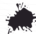
Resistente a salpicaduras

¡Destácate en el Grupo! El “Traje Desechable Orange Air Protection” no solo garantiza seguridad, sino que también te permite destacarte en cualquier entorno de trabajo. Su color anaranjado no solo es moderno, sino que también mejora la visibilidad y la seguridad en tu lugar de trabajo. Además de cumplir con los estándares más exigentes, nuestro traje Worksafe te permite trabajar con confianza y estilo.