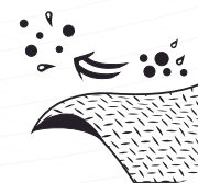
Resistente a partículas

Material SMS para Mayor Comodidad: El “Traje Desechable Orange Air Protection” ha sido diseñado pensando en tu comodidad en entornos laborales exigentes. Está confeccionada con material SMS, que ofrece una mayor transpiración y un ambiente corporal aireado. Esto se traduce en un confort excepcional durante largas jornadas de trabajo, permitiéndote mantener un nivel óptimo de comodidad incluso en las condiciones más desafiantes. El material SMS no solo garantiza tu seguridad, sino que también te brinda la sensación de frescura y bienestar que necesitas para rendir al máximo en tu labor diaria.