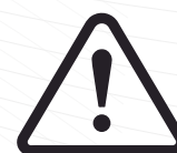
NO USAR EN EXPOSICIÓN A ALTAS TEMPERATURAS