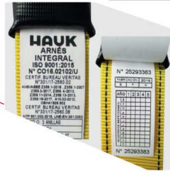
IDENTIFICACIÓN Y TRAZABILIDAD