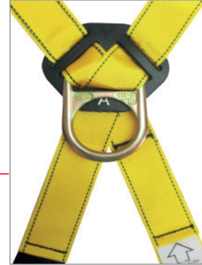
VISTA POSTERIOR ANILLA DORSAL