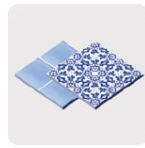
Loseta y cerámica