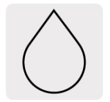
Para cortes en húmedo