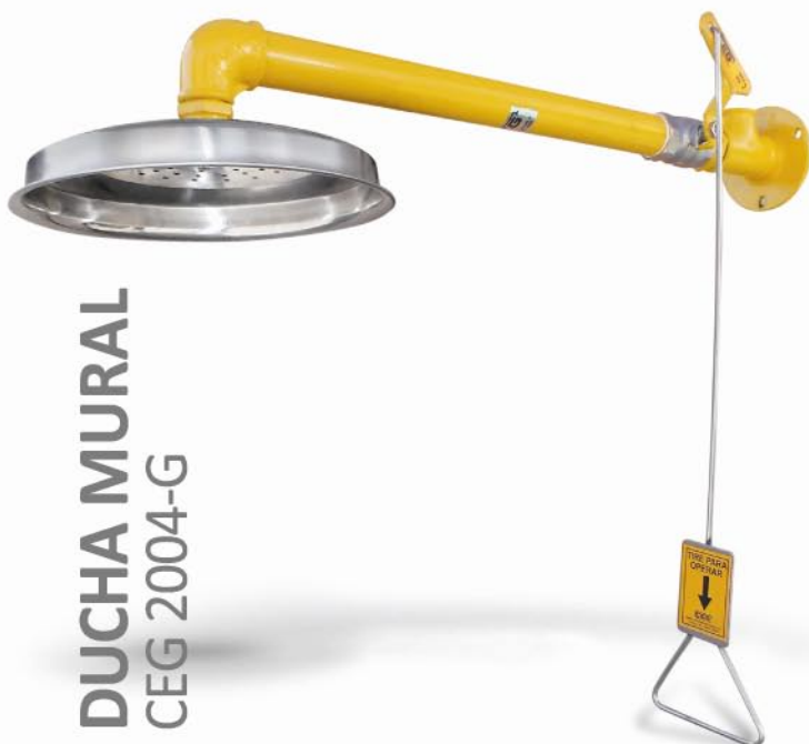
DUCHA MURAL CEG 2004-G