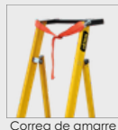
Correa de amarre

*Los accesorios de las escaleras se venden por separado y complementan su funcionamiento. Para consultas, contacte a su asesor comercial. *Barandas incluidas a partir de la referencia de 4ft.