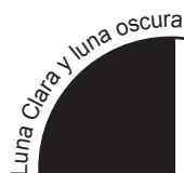
Luna Clara y luna oscura